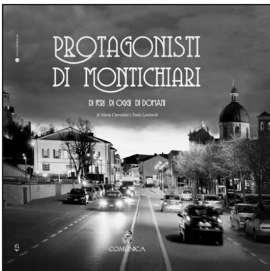
La copertina del libro.

Alla capitale della Bassa Bresciana seguiranno, a partire dal 2011, altri comuni, paesi, città o aree geografiche, della nostra Provincia ma anche di altre Province o Regioni che vorranno far parte del progetto “I Protagonisti”, che troverà ampio spazio anche su internet nel sito della Città dei Talenti ( www.youdream.info ).