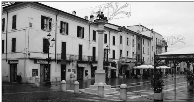
Luminarie e pavimentazione in via Martiri della Libertà.