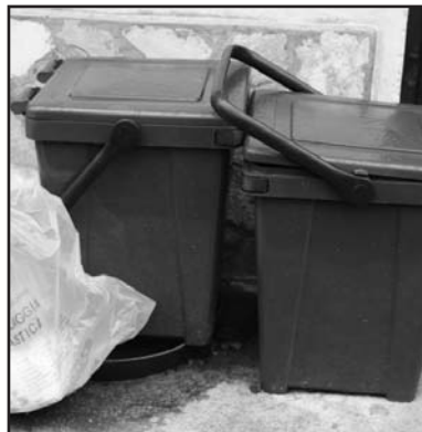
Il kit per la raccolta differenziata, addebitato in bolletta con 12,67 euro.

Insomma, è sorpresa generale quella che si registra fra la gente: ci avevano detto che non ci sarebbero stati aumenti, che i bidoncini per la raccolta differenziata erano gratuiti, invece non è vero niente. Il comune di Montichiari continua ad ampliare le discariche, ne apre di nuove e addirittura è socio in una di essa, perciò i montecclaresi dovrebbero avere tariffe ridotte e pagare meno; si vede proprio che le casse del Comune sono vuote, che c'è bisogno di soldi! Queste e altre le considerazioni che si colgono nei capannelli, o