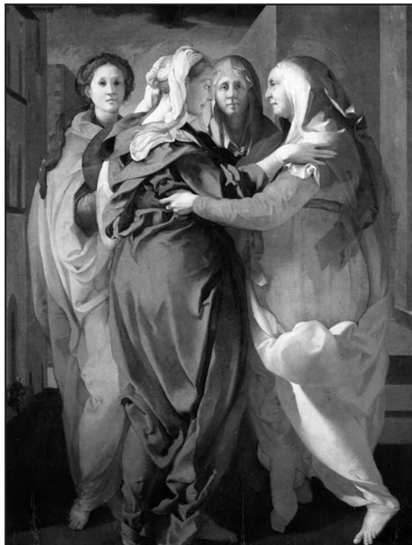
MARIA E LA CUGINA ELISABETTA, DUE DONNE "IN ATTESA". Il dipinto, intitolato "Visitazione" è un'opera del Pontormo (1528-1529), Carmignano, Firenze. Si tratta di un capolavoro del primo Manierismo.

Una volta, della mamma che aspettava un bimbo si diceva: "è in attesa!". Il senso di quell'espressione suona pregnante nello scorrere di Nativity : Maria e Elisabetta si incontrano, due donne "in attesa", l'una di Gesù, figlio di Dio, l'altra di Giovanni il precursore, mentre lo Spirito so-